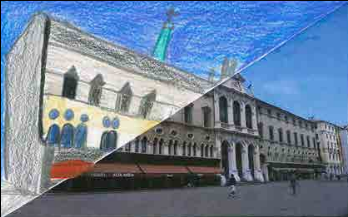
Vicenza, Monte di Pietà

A sinistra puoi trovare il Monte di Pietà dove entravano persone di gran varietà per scambiare collane e bracciali nei momenti più cruciali.