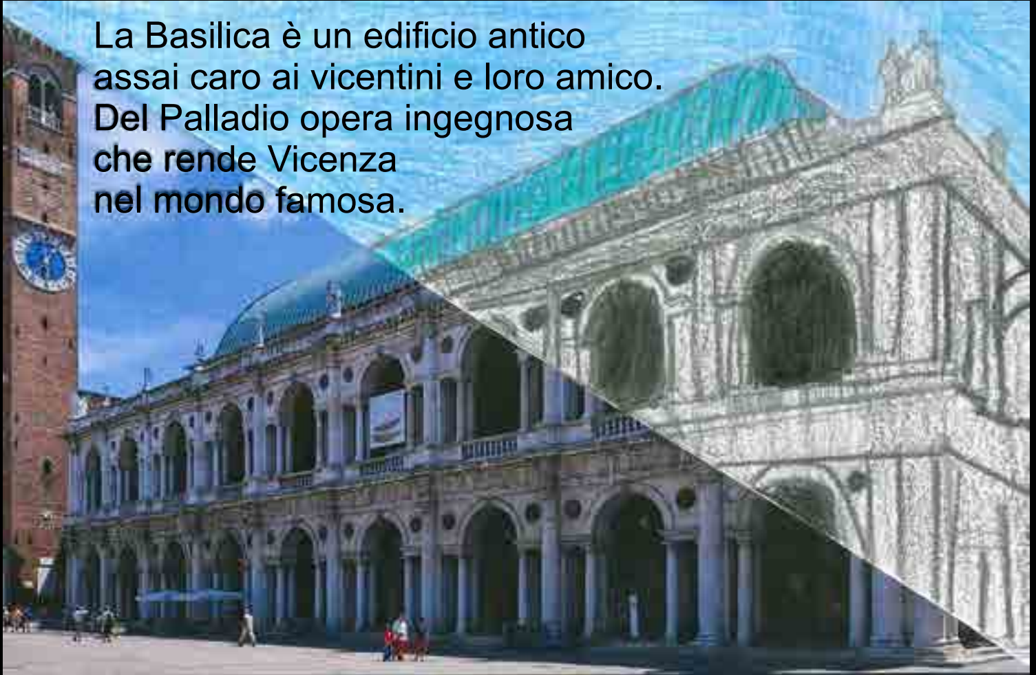
Vicenza, Basilica Palladiana

La Basilica è un edificio antico assai caro ai vicentini e loro amico. Del Palladio opera ingegnosa che rende Vicenza nel mondo famosa.