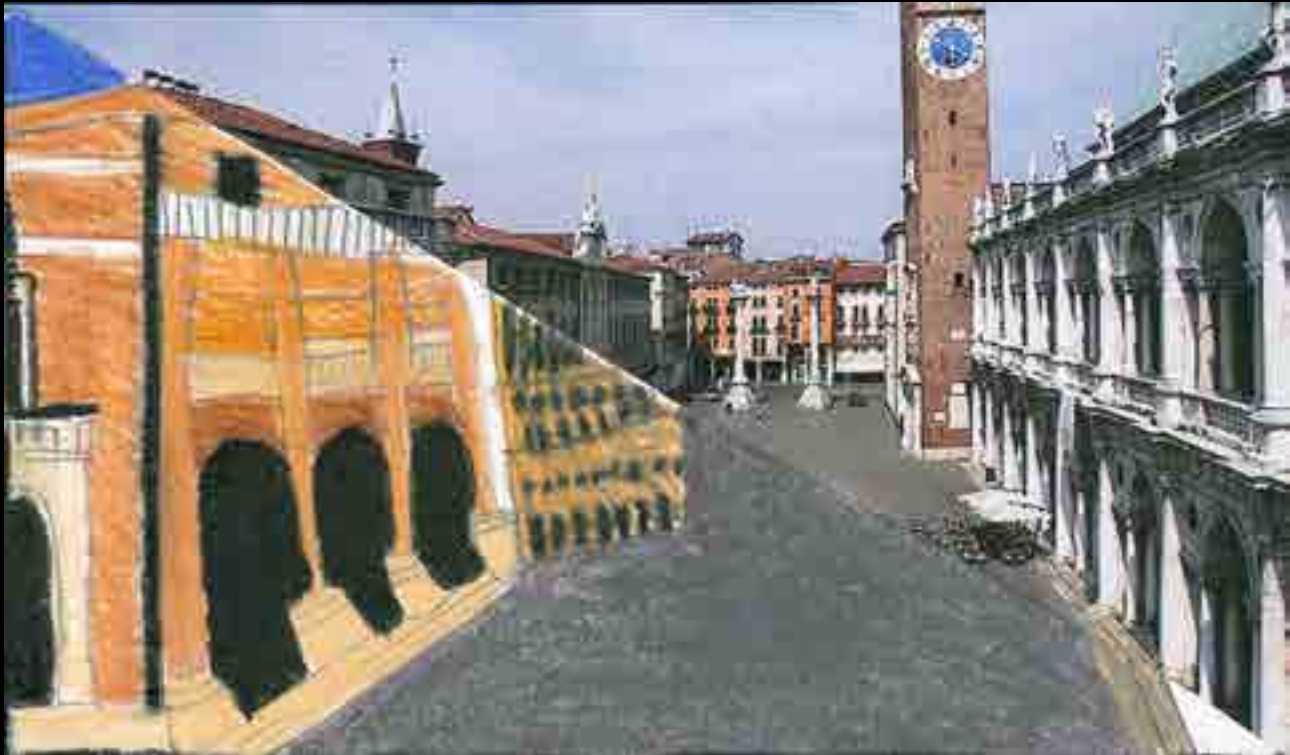
Vicenza, piazza dei Signori

In piazza dei Signori non senti mai rumori perchè è un'isola pedonale e passeggiare non è mai banale.