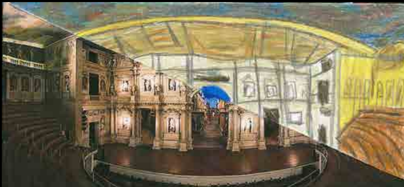
Vicenza, Teatro Olimpico

Se notizie più precise vuoi in ogni momento sai che puoi leggere con attenzione il libretto che contiene quanto abbiamo detto